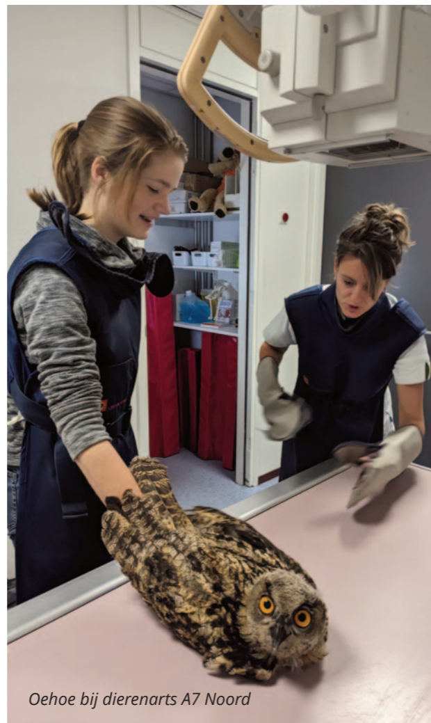
Oehoe bij dierenarts A7 Noord

Als team willen wij iedereen weer bedanken die, op welke manier dan ook, een bijdrage heeft geleverd aan dit mooie resultaat! Graag tot ziens op de Fûgelhelling.